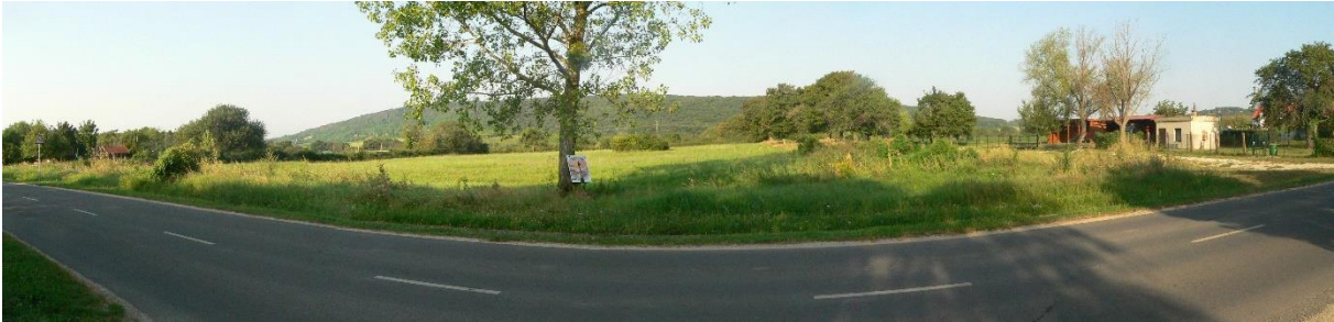
1. ábra: Az 1. sz. módosítással érintett 0234/2 hrsz-ú ingatlan a Fő utca túloldaláról a 2023. augusztus 26-án készült felvételen