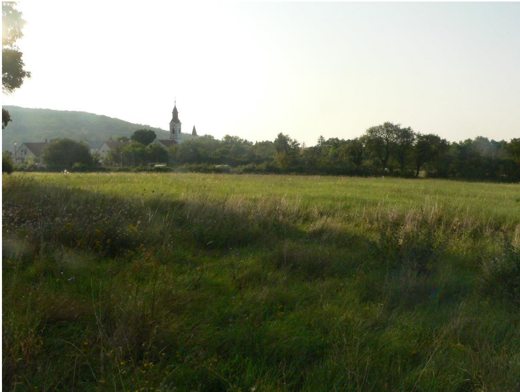
2. ábra: Az 1. sz. módosítással érintett 0234/2 hrsz-ú ingatlan északnyugatról a 2023. augusztus 26-án készült felvételen