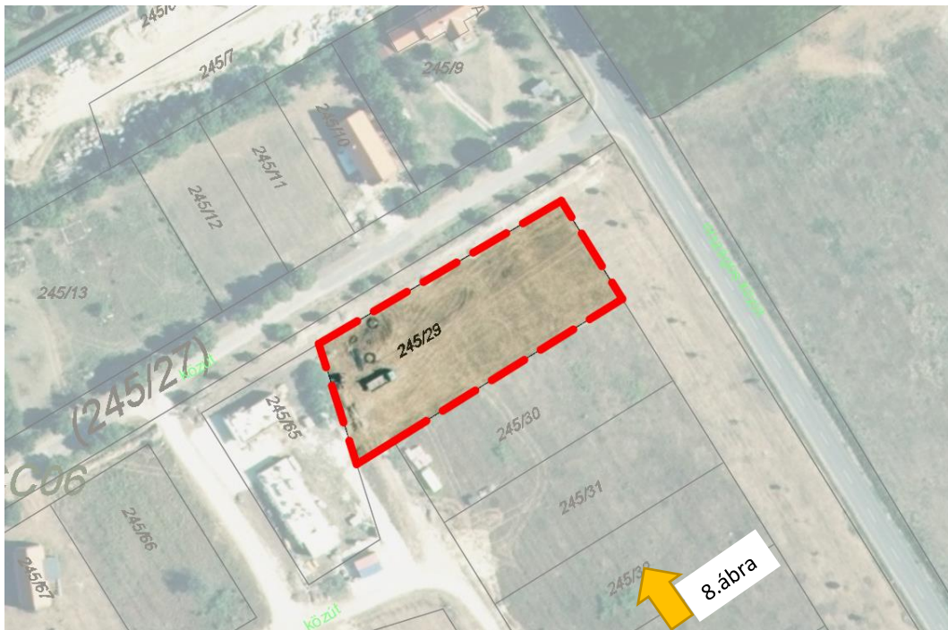
9. ábra: A 3. sz. módosítással érintett 245/29 hrsz-ú ingatlan az E-TÉR adatszolgáltatással nyújtott ortofotón