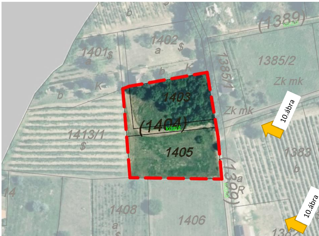
12. ábra: Az 5. sz. módosítással érintett 1403-1405 hrsz-ú ingatlanok az E-TÉR adatszolgáltatással nyújtott ortofotón