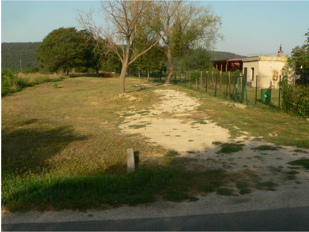
3. ábra: Az 1. sz. módosítással érintett 0234/2 hrsz-ú ingatlan északi megközelítését biztosító 196/1 hrsz-ú önkormányzati útként nyilvántartott területsáv a 2023. augusztus 26-án készült felvételen