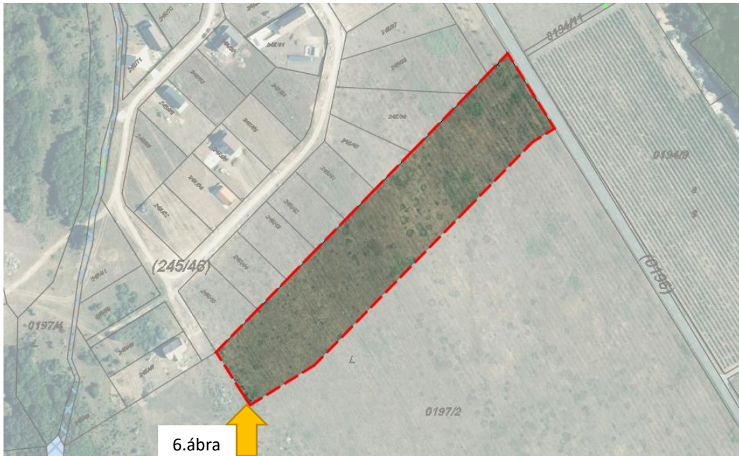
6. ábra 7. ábra: Az 2. sz. módosítással érintett 0197/2 hrsz-ú ingatlan az E-TÉR adatszolgáltatással nyújtott ortofotón