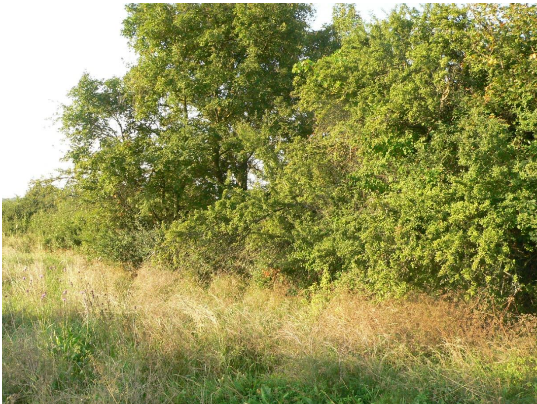
4. ábra: Az 1. sz. módosítással érintett 0234/2 hrsz-ú ingatlan nyugati felén található, a területet lezáró, véderdőként tervezett erdősáv a 2023. augusztus 26-án készült felvételen