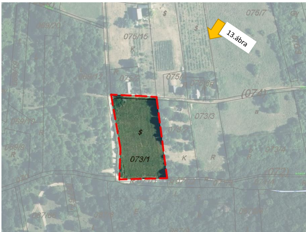
14. ábra: Az 5. sz. módosítással érintett (074) és 073/1 hrsz-ú ingatlanok az E-TÉR adatszolgáltatással nyújtott ortofotón