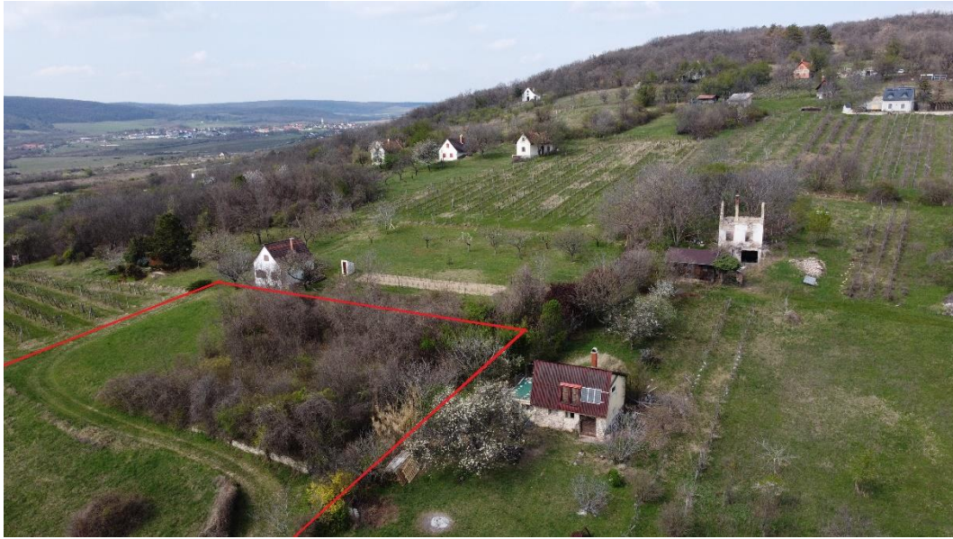
11. ábra: Az 5. sz. módosítással érintett 1403 hrsz-ú ingatlan a 2024. március 22-én készült drónfotón