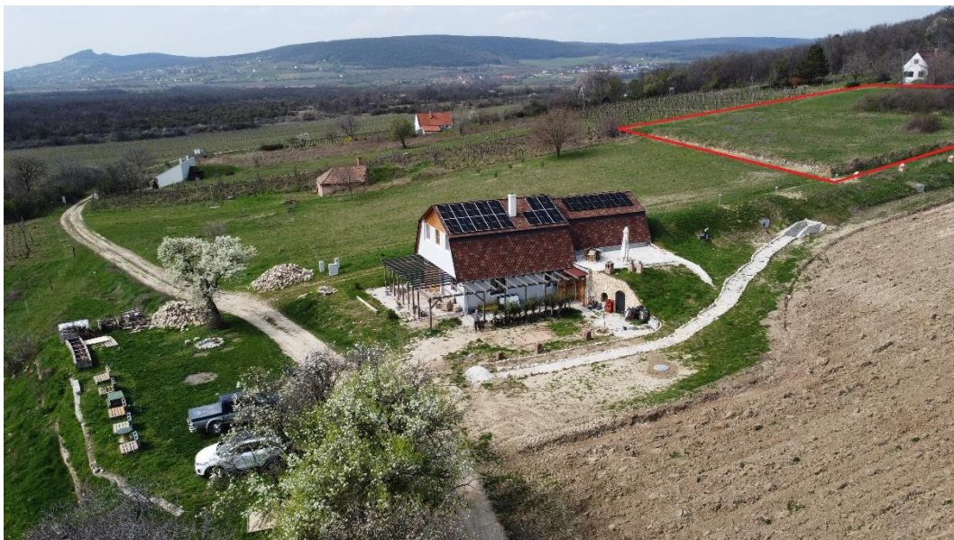
10. ábra: Az 5. sz. módosítással érintett 1405 hrsz-ú ingatlan a 2024. március 22-én készült drónfotón