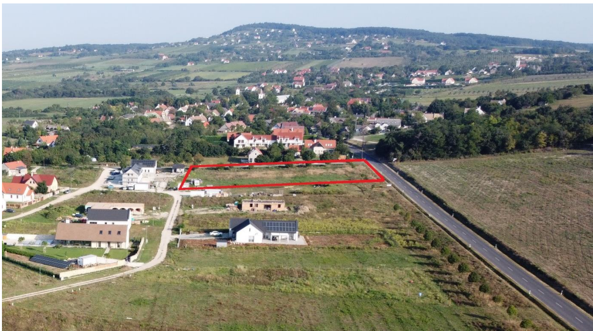
8. ábra: Az 3. sz. módosítással érintett 245/29 hrsz-ú ingatlan a 2023. augusztus 26-án készült drónfotón