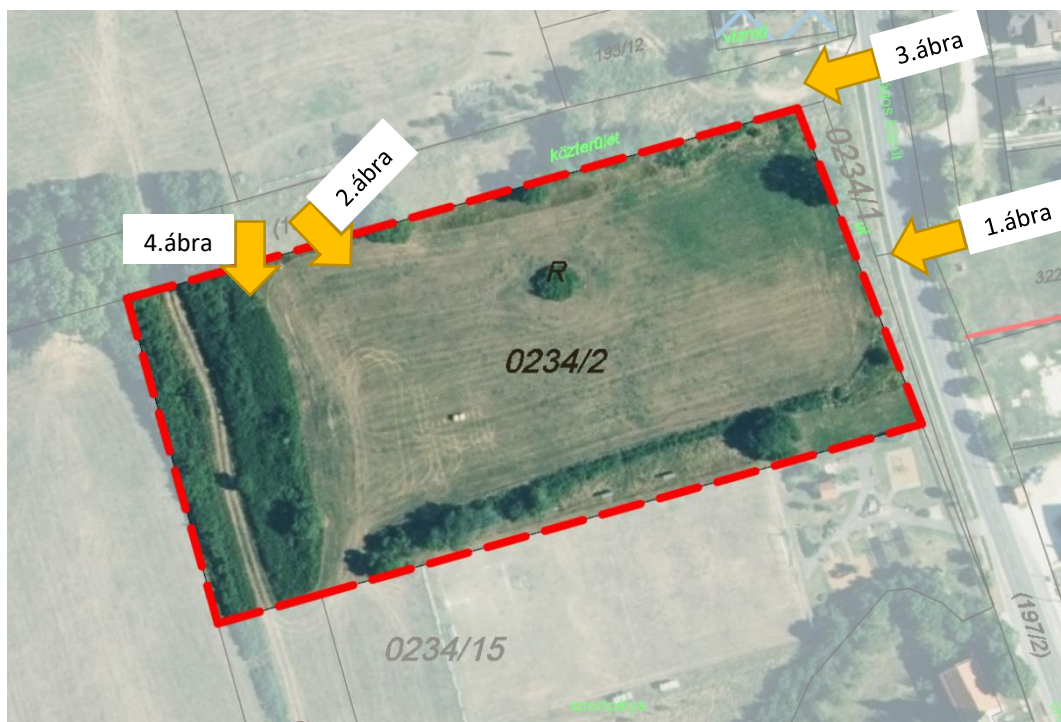
5. ábra: Az 1. sz. módosítással érintett 0234/2 hrsz-ú ingatlan az E-TÉR adatszolgáltatással nyújtott ortofotón