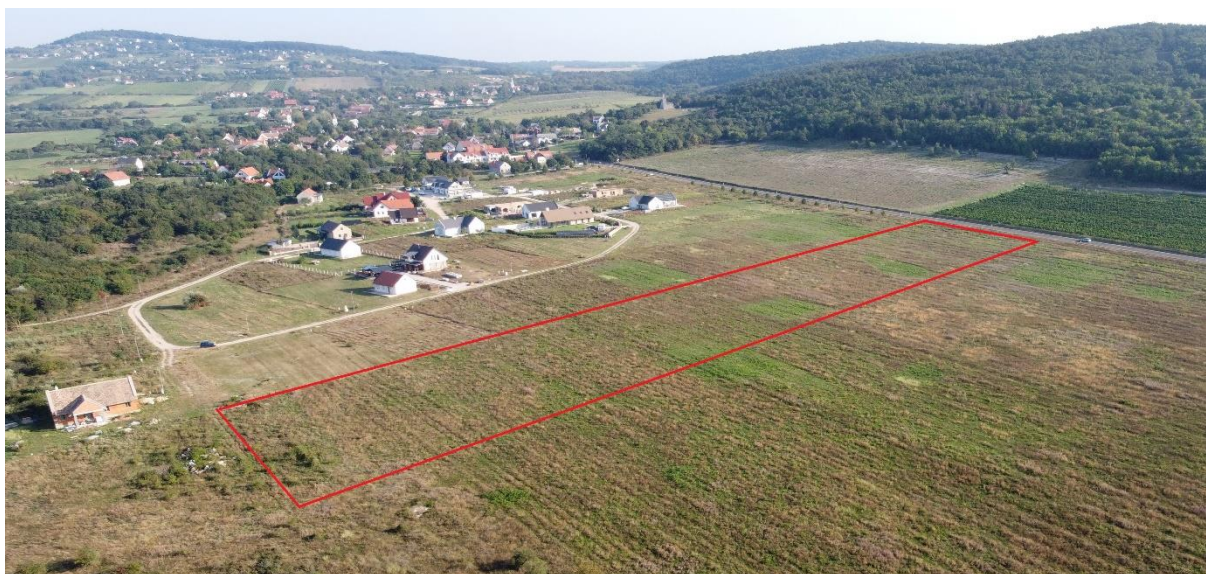
6. ábra: Az 2. sz. módosítással érintett terület a 0197/2 hrsz-ú ingatlan egy részén a 2023. augusztus 26-án készült drónfotón